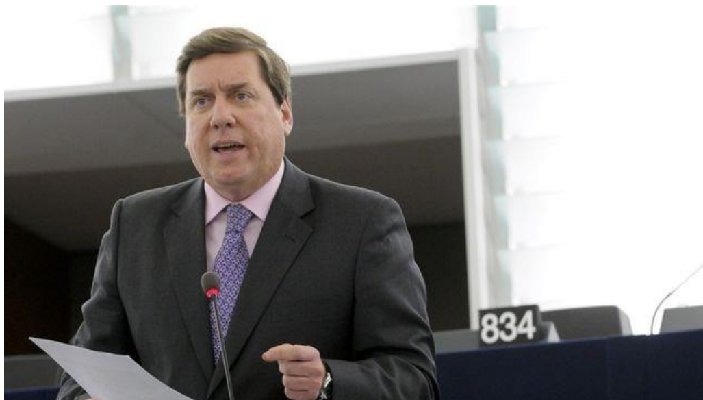
Gabriel Mato, eurodiputado canario del PP

El eurodiputado canario del PP valora la petición, que tiene origen en la Comisión de Agricultura del Parlamento de la UE; también se ha notificado la posibilidad de montar un Posei para las actividades pesqueras