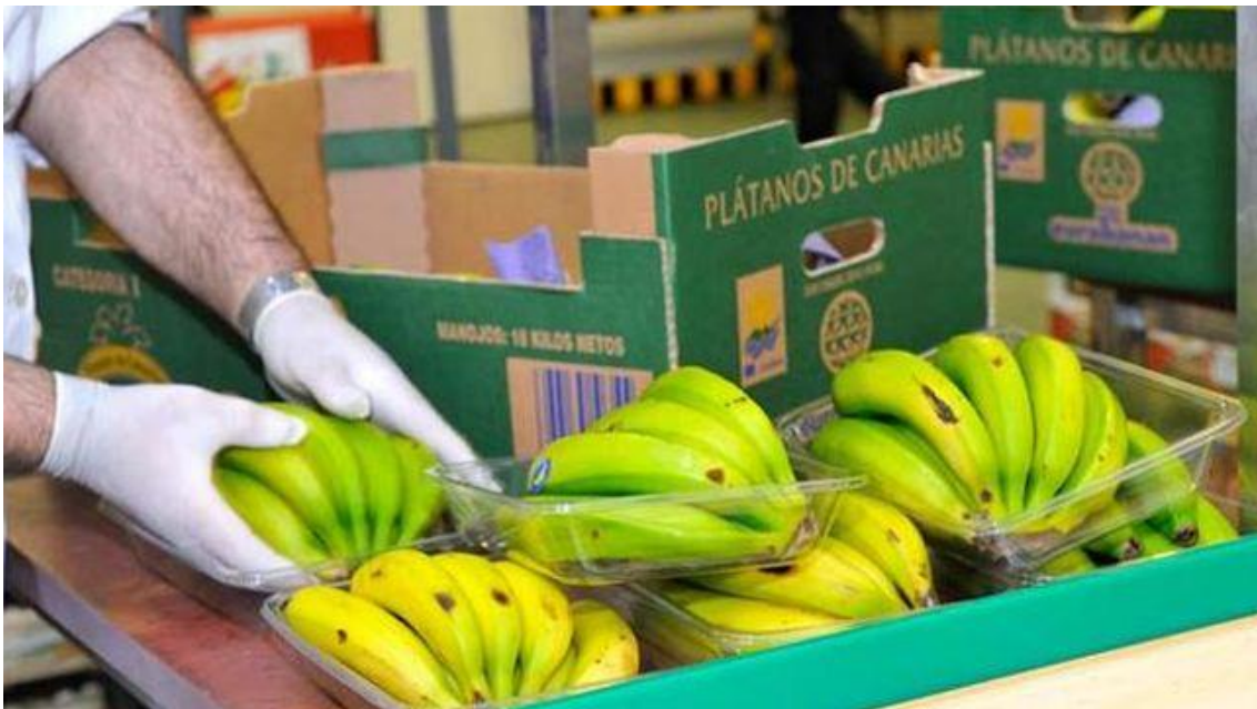
Envasado de plátano con origen en Canarias

prácticamente los mismos niveles que en esas fechas del año precedente y más cerca del segundo porcentaje que del primero