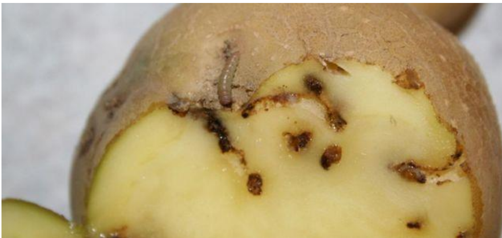
Patata afectada por la polilla guatemalteca

La corporación insular ha habilitado puntos de recogida para que los afectados depositen sin coste las denominadas 'papas bichadas'