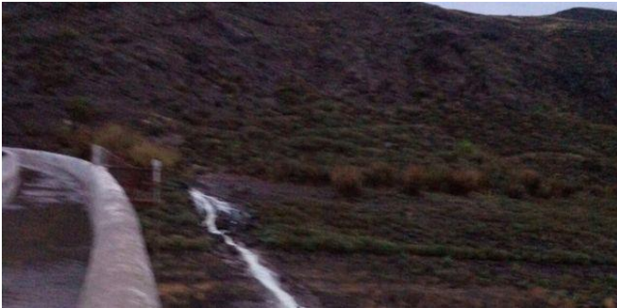
Presa de Chira (Cabildo de Gran Canaria)

es posible recopilar parte de la producción de Las Palmas de Gran Canaria, Telde y Arinaga y enviarla al sur y sus medianías.