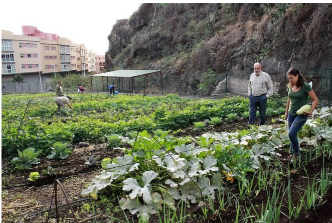
Huerto urbano del Velachero.

Los participantes cuentan ya con una abundante cosecha de productos agrícolas destinados al autoconsumo