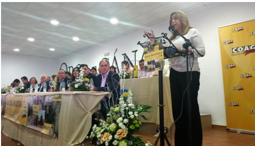
Susana Díaz, Presidenta de la Junta de Andalucía, durante su intervención.