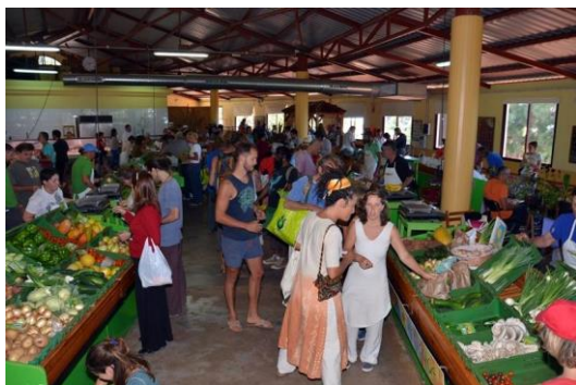
Mercadillo de Puntagorda.

EL CABILDO PIDE QUE LOS PRODUCTORES, ELABORADORES Y COMERCIALIZADORES ECOLÓGICOS SOLO PAGUEN UNA ÚNICA TASA D.M.