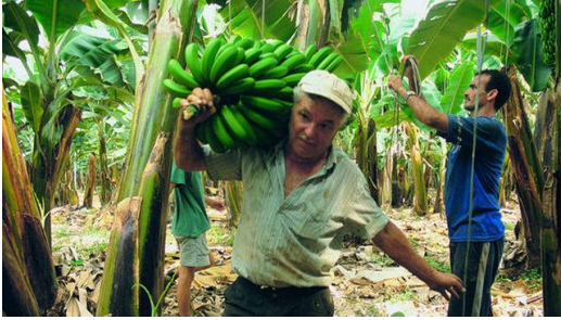
Corte de fruta en un finca de plátanos, en Canarias

Las Palmas de Gran Canaria: C./Miguel Sarmiento, 2 - 35004 Telf. 928 369 806 – Fax. 928 385 634 Santa Cruz de Tenerife: C/. Cairasco, 5, Edif. Retama, 1º A – 38004 Telf. 922 299 655 – Fax. 922 299 656 La e San Nicolás: Avda. Los Cardones, 25 – 35470 Telf. 928 891 001 – Fax. 928 891 288 Santa María de Guía: C/. Sancho de Vargas, 19, interior bajo – 35450 Telf. 928 896 790 – Fax. 928 896 790