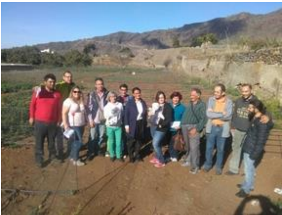
Imagen en una de las zonas donde se lleva a cabo este proyecto social y económico. | DA

El Ayuntamiento de Los Llanos de Aridane entregó esta mañana los primeros 11 de los 30 huertos municipales que la corporación municipal ha puesto a disposición de los vecinos interesados en una finca urbana propiedad del consistorio, ubicada en el Camino de Los Choriceros y que cuenta con una superficie de más de 7.300 metros cuadrados.