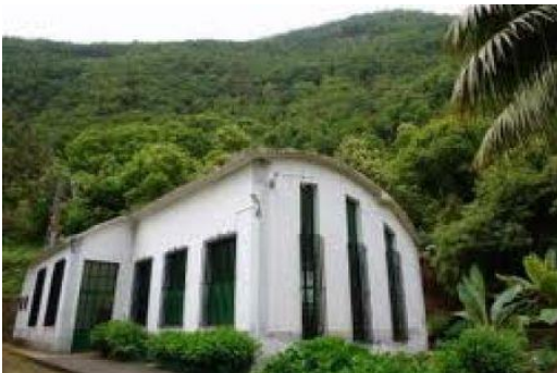
El Mulato, en San Andrés y Sauces. Archivo.

La plataforma quiere que se declare formalmente la extinción de la concesión del aprovechamiento hidroeléctrico a Endesa-Enel