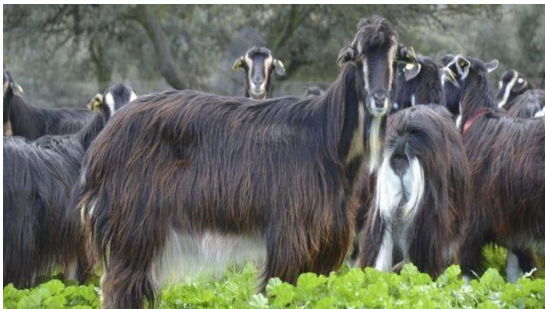
Cabras asilvestradas.

Los interesados deben presentar una instancia en cualquiera de los registros desconcentrados con los que cuenta la corporación insular hasta el 22 de febrero.