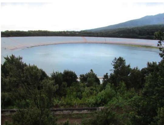
Laguna de Barlovento.

En la Laguna de Barlovento entraron un total de 298.000 pipas entre las 00:00 y las 12:00 horas de ayer y el total hasta esta mañana a las 8:00 es de 322.136 pipas D.M.