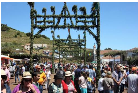
San Antonio del Monte.

En esta edición de la fiesta se ha contado con la participación de 500 cabezas de ganado.