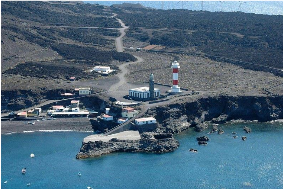
Imagen parcial de la costa de Fuencaliente. | DA

Las Palmas de Gran Canaria: C/. Miguel Sarmiento, 2 – 35004 Telf. 928 369 806 – Fax. 928 385 634 La Aldea de San Nicolás: Avda. Los Cardones, 25 – 35470 Telf. 928 885 085 – Fax. 928 891 288 Santa María de Guía: C/. Sancho de Vargas, 19, interior bajo – 35450 Telf. 928 896 790 – Fax. 928 896 790 Santa Cruz de Tenerife: C/. Cairasco, 5, Edif. Retama, 1º A – 38004 Telf. 922 299 655 – Fax. 922 242 060