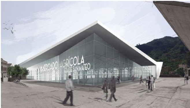
Diseño del mercado agrícola de San Mateo

La obra costará 1,3 millones de euros y ha sido propuesta por la Mancomunidad de Medianías; tiene un plazo de ejecución de nueve meses, con finalización en 2018..