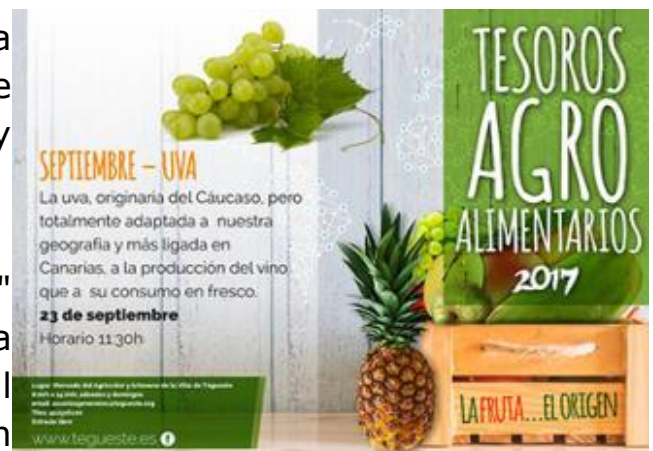
Imagen del cartel anunciador de la actividad de este sábado 23 de septiembre en el Mercado del Agricultor y el Artesano de Tegueste.

El programa "Tesoros Agroalimentarios" alcanza su tercera sesión con la presentación de la Uva como principal protagonista. Las actividades tendrán lugar este sábado 23 de septiembre, a partir de las 11:30 horas, en el Mercado del Agricultor y el Artesano de Tegueste.