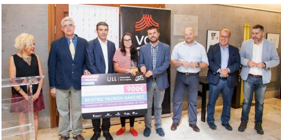
Foto de familia con los participantes en el acto de clausura

Viajamos al 2034 con veintidós especialistas, siete soñadores y seis dibujantes de cómic. Anímate a la aventura de descubrir lo que está por venir.