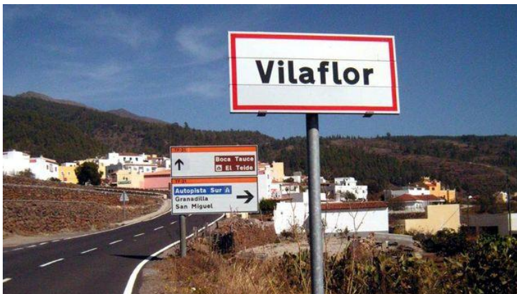
Imagen de archivo de Vilaflor, en Tenerife

Asaga insta a los municipios de las zonas costeras de la isla a que se abastezcan de agua industrial procedente de las desaladoras para que de esta forma se libere agua de pozos y galerías en las medianías.