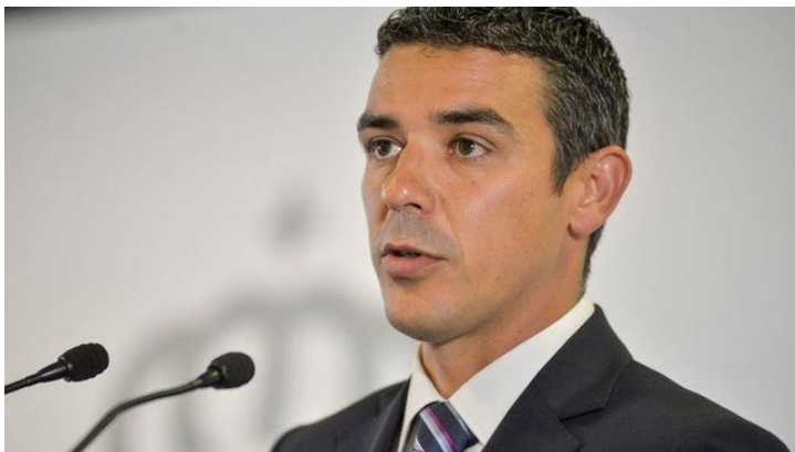
Narvay Quintero, consejero canario de Agricultura

Narvay Quintero intervino este lunes en el Foro del Sector Agroalimentario, celebrado en la sede santacrucera de Presidencia del Gobierno de Canarias