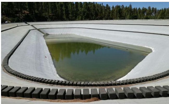
Imagen de archivo de la aalsa de Montaña del Arco, en el municipio de Puntagorda.

El nivel medio de llenado de las 11 balsas del Consejo Insular de Aguas está solo al 19% de su capacidad. Martín Macho - Santa Cruz de La Palma