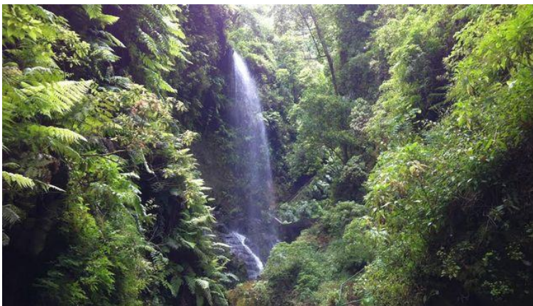
Imagen de archivo de la cascada del bosque de Los Tilos, en el municipio de San Andrés y Sauces.