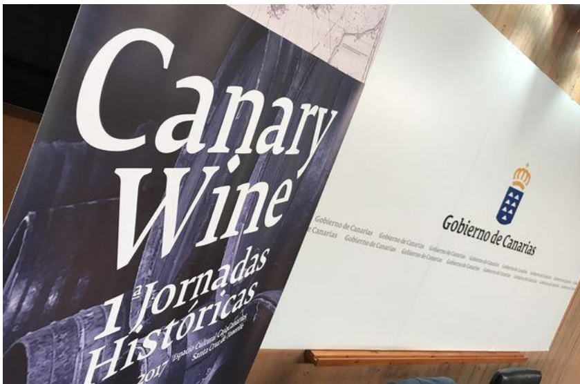
Imagen de marca del foro, que tendrá lugar el 8 y 9 de este mes en la capital tinerfeña

Las Palmas de Gran Canaria: C/. Miguel Sarmiento, 2 – 35004 Telf. 928 369 806 – Fax. 928 385 634 La Aldea de San Nicolás: Avda. Los Cardones, 25 – 35470 Telf. 928 885 085 – Fax. 928 891 288 Santa María de Guía: C/. Sancho de Vargas, 19, interior bajo – 35450 Telf. 928 896 790 – Fax. 928 896 790 Santa Cruz de Tenerife: C/. Cairasco, 5, Edif. Retama, 1º A – 38004 Telf. 922 299 655 – Fax. 922 242 060