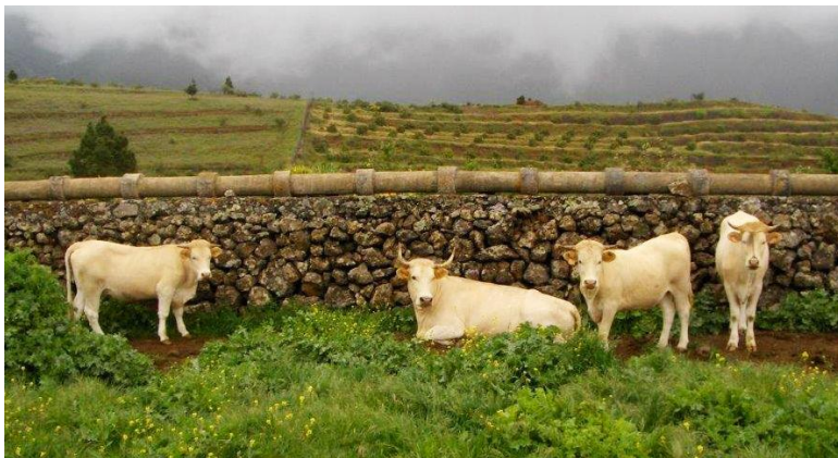
Vacuno de raza palmera.

Este distintivo, el primero para una raza ganadera canaria, aporta un carácter diferenciador a los productos que lo portan y es una garantía para el consumidor sobre su origen.