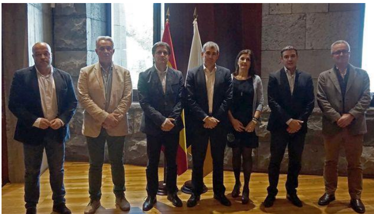
Foto de familia con representantes de Asprocan, el presidente Clavijo y el consejero Narvay Quintero