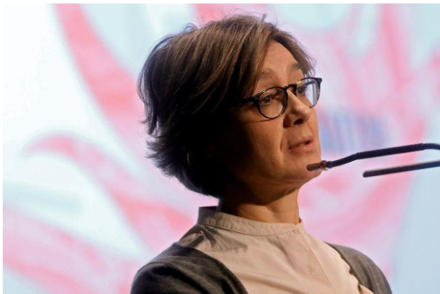
La ministra de Agricultura, Isabel García Tejerina.