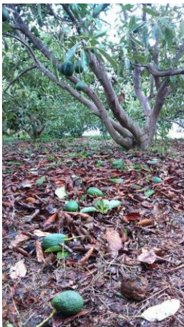
Agucates en el suelo por el viento.