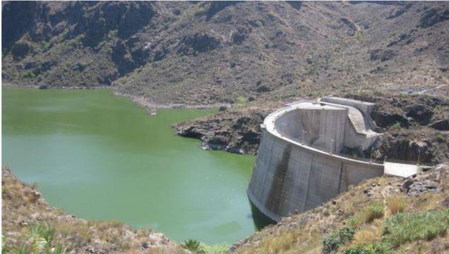
Presa de Soria.

Las Palmas de Gran Canaria: C/. Miguel Sarmiento, 2 – 35004 Telf. 928 369 806 – Fax. 928 385 634 La Aldea de San Nicolás: Avda. Los Cardones, 25 – 35470 Telf. 928 885 085 – Fax. 928 891 288 Santa María de Guía: C/. Sancho de Vargas, 19, interior bajo – 35450 Telf. 928 896 790 – Fax. 928 896 790 Santa Cruz de Tenerife: C/. Cairasco, 5, Edif. Retama, 1º A – 38004 Telf. 922 299 655 – Fax. 922 242 060