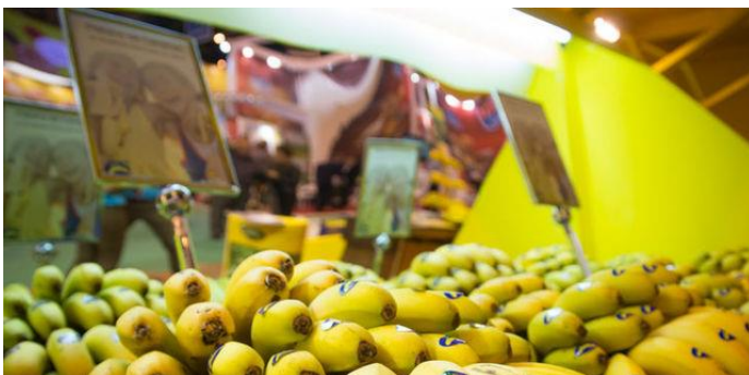
Manillas de fruta con el distintivo de Plátano de Canarias

Atendiendo a lo retirado del mercado esta semana, a los productores isleños les sobra más de un millón de kilos de fruta por cada siete días, sobre todo porque hay mucho volumen sin vender acumulado en las cámaras de maduración peninsulares y también debido a que la venta ahora está muy parada, en lo que tiene algo que ver la avalancha de banana que llega a España desde Francia, que es fruta sobrante y barata. Todo esto ha aconsejado no asumir los costes de transporte al mercado peninsular cuando no hay garantías de que se produzca un retorno económico por la venta para los cosecheros.