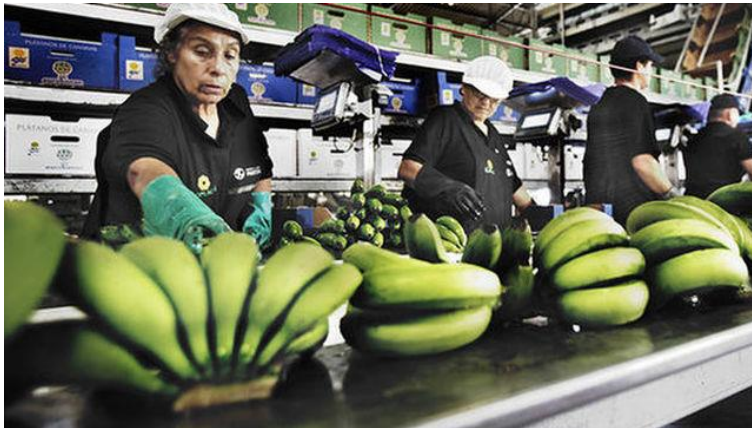
Imagen de archivo de un empaquetado de plátanos, en Canarias

Tanta inutilización de mercancía, con 2,3 millones de kilos en solo 15 días y más del 10% de lo sacado de las fincas en dos semanas, no es habitual en otoño, cuando los plataneros suelen tener mejor comercialización en Península y precios más altos. La llamada 'pica', que es el plátano que se corta pero no sale al mercado, ya acumula en lo que va de 2017 una cifra global en torno a los 14 millones de kilos y amenaza con estar cerca del umbral descomunal de 2016, entonces con más de 15 millones. Román Delgado - Santa Cruz de Tenerife