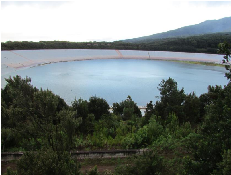
Laguna de Barlovento.

Esta obra permitirá intensificar y diversificar la producción agrícola del municipio, que pertenece casi íntegramente al procomún de los vecinos D.M.