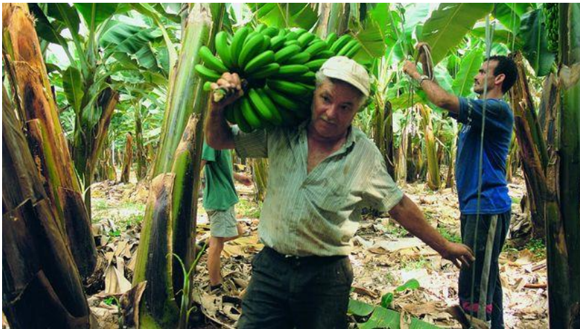
Corte de piñas en una platanera, en Tenerife

El año 2017 pasará a la historia del plátano isleño como uno de los dos peores desde que esta actividad agrícola y exportadora perdiera la reserva del mercado nacional el 1 de julio de 1993, cuando nació la Organización Común de Mercado (OCM) del plátano (hoy desmantelada) tras la plena entrada (con matices) de Canarias en la entonces Comunidad Económica Europea (CEE), a partir del 1 de enero de 1992.