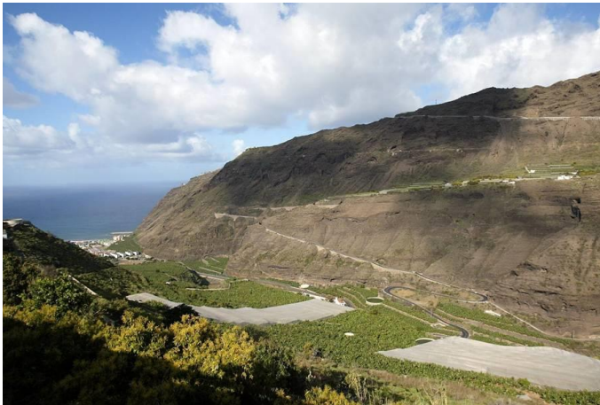
Imagen del Valle de Aridane, hasta donde se trasvasa agua desde la comarca Este de la Isla.

sucediendo en los últimos tiempos, hiciera necesaria una mayor cantidad de agua elevada para su uso en el riego agrario.