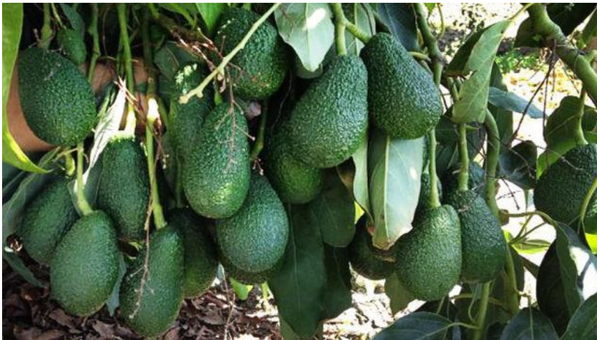
Frutos en un árbol de aguacate

Plantean, en primer lugar, soluciones ante "la oleada de robos" en sus cultivos que "durante un largo tiempo" llevan padeciendo y que "hasta ahora soportaban en silencio".