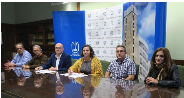
Imagen de la firma del acuerdo. | DA