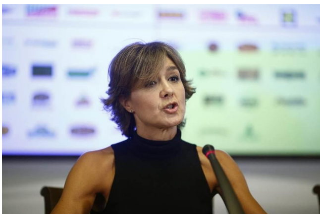
Imagen de archivo de Isabel García Tejerina.