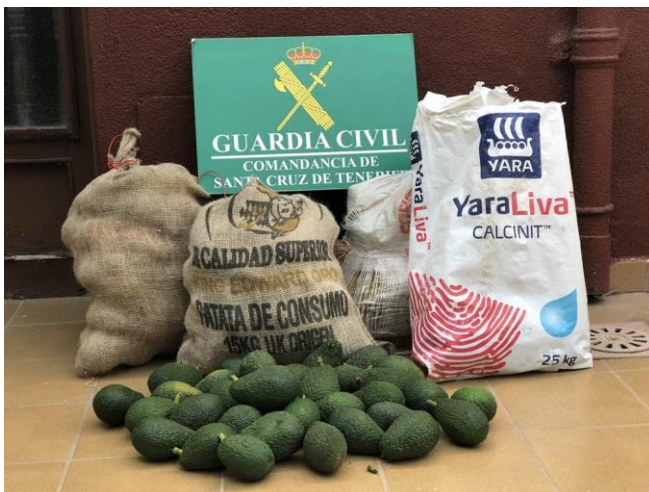
Aguacates robados.