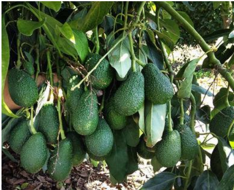
Frutos en un árbol de aguacate

Las Palmas de Gran Canaria: C/. Miguel Sarmiento, 2 – 35004 Telf. 928 369 806 – Fax. 928 385 634 La Aldea de San Nicolás: Avda. Los Cardones, 25 – 35470 Telf. 928 885 085 – Fax. 928 891 288 Santa María de Guía: C/. Sancho de Vargas, 19, interior bajo – 35450 Telf. 928 896 790 – Fax. 928 896 790 Santa Cruz de Tenerife: C/. Cairasco, 5, Edif. Retama, 1º A – 38004 Telf. 922 299 655 – Fax. 922 242 060