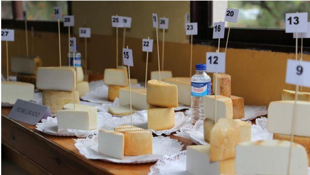
Imagen de archivo de varios quesos de La Palma con Denominación de Origen.

Las Palmas de Gran Canaria: C/. Miguel Sarmiento, 2 – 35004 Telf. 928 369 806 – Fax. 928 385 634 La Aldea de San Nicolás: Avda. Los Cardones, 25 – 35470 Telf. 928 885 085 – Fax. 928 891 288 Santa María de Guía: C/. Sancho de Vargas, 19, interior bajo – 35450 Telf. 928 896 790 – Fax. 928 896 790 Santa Cruz de Tenerife: C/. Cairasco, 5, Edif. Retama, 1º A – 38004 Telf. 922 299 655 – Fax. 922 242 060