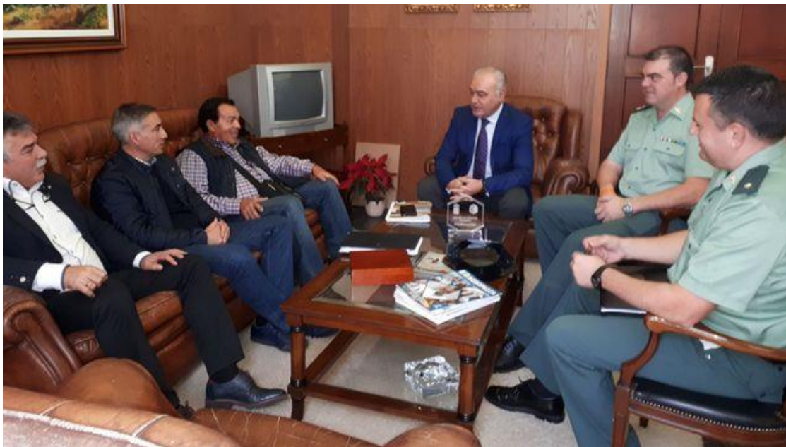
Reunión celebrada la Dirección Insular de la Administración General del Estado en La Palma.

Solicita la colaboración ciudadana para denunciar la presencia de intrusos en las explotaciones, así como evitar la compra de este producto en establecimientos no autorizados por "sus riesgos para la salud".