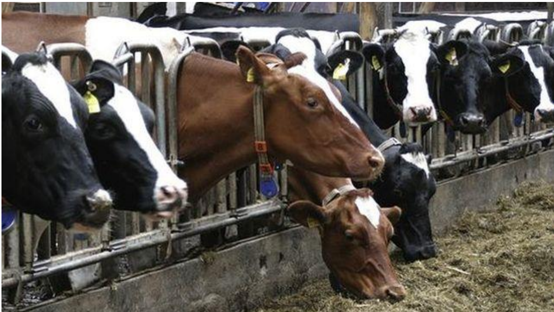
Vacas de leche estabuladas, en Canarias

Las cuadras con autorización definitiva están ubicadas en los municipios de Tacoronte, Granadilla de Abona y El Rosario (Tenerife), Yaiza (Lanzarote) y Santa Lucía de Tirajana (Gran Canaria)