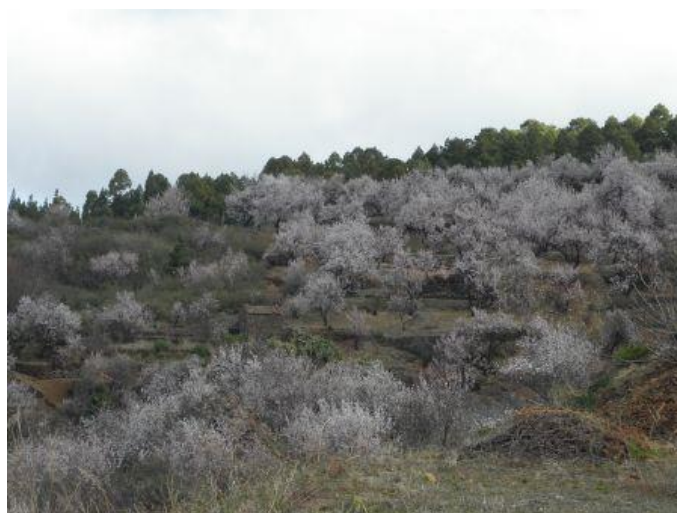
Almendros en flor en Puntagorda.

Los festejos están dedicados este año a Los Llanos de Aridane y actuarán Los Arrieros en el Festival de Música Tradicional