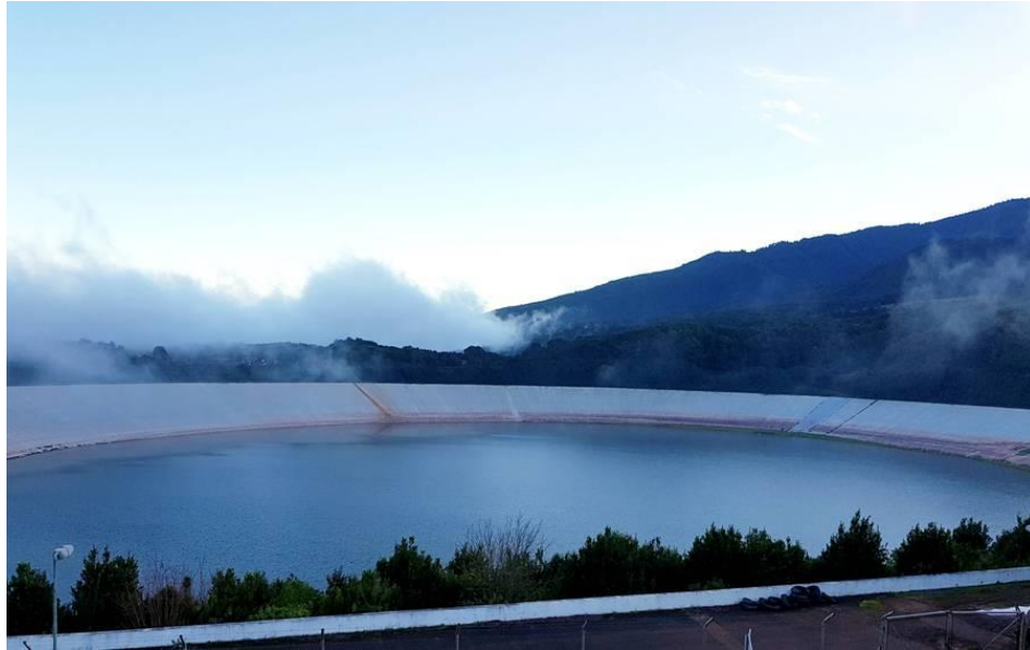
El embalse de La Laguna de Barlovento.

Las Palmas de Gran Canaria: C/. Miguel Sarmiento, 2 – 35004 Telf. 928 369 806 – Fax. 928 385 634 La Aldea de San Nicolás: Avda. Los Cardones, 25 – 35470 Telf. 928 885 085 – Fax. 928 891 288 Santa María de Guía: C/. Sancho de Vargas, 19, interior bajo – 35450 Telf. 928 896 790 – Fax. 928 896 790 Santa Cruz de Tenerife: C/. Cairasco, 5, Edif. Retama, 1º A – 38004 Telf. 922 299 655 – Fax. 922 242 060