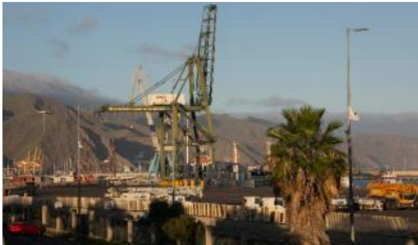
Imagen de archivo de contenedores en el Puerto de Santa Cruz. José Luis González

En el caso de que se detecte la presencia de esta plaga, supondría la paralización de la exportación de esta fruta desde las islas