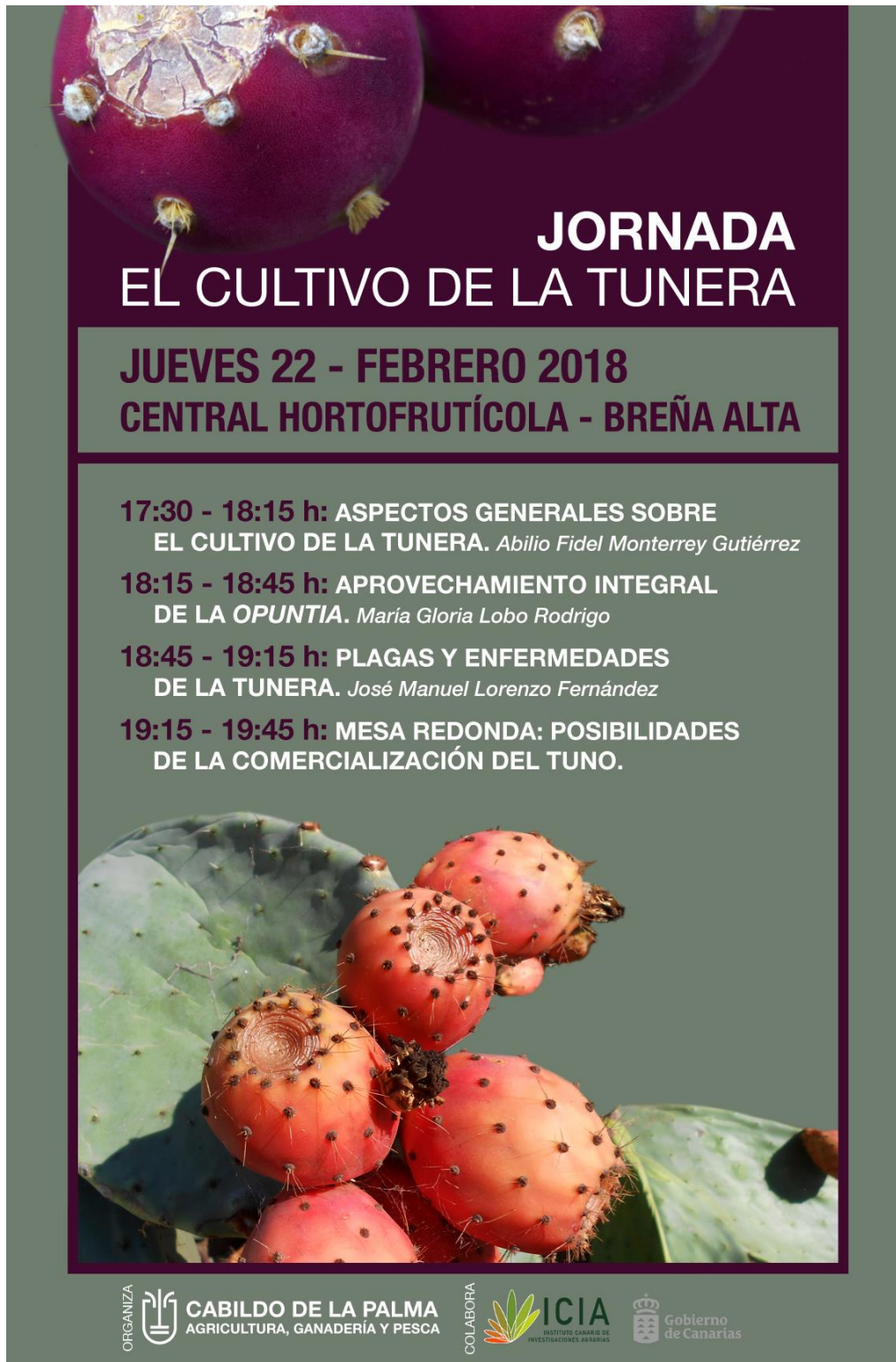
Cartel de las jornadas sobre la tunera.

Las Palmas de Gran Canaria: C/. Miguel Sarmiento, 2 – 35004 Telf. 928 369 806 – Fax. 928 385 634 La Aldea de San Nicolás: Avda. Los Cardones, 25 – 35470 Telf. 928 885 085 – Fax. 928 891 288 Santa María de Guía: C/. Sancho de Vargas, 19, interior bajo – 35450 Telf. 928 896 790 – Fax. 928 896 790 Santa Cruz de Tenerife: C/. Cairasco, 5, Edif. Retama, 1º A – 38004 Telf. 922 299 655 – Fax. 922 242 060