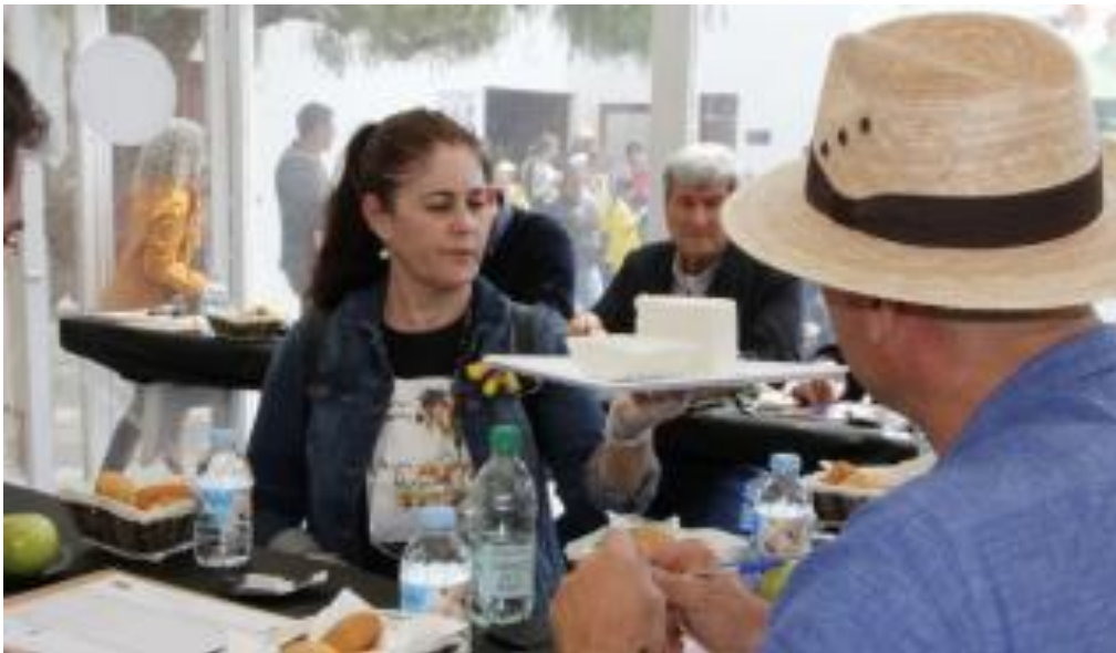
Muestra de Ganado y Mercado del Queso en Uga

Ganaderos, queserías, agricultores y visitantes valoran positivamente la organización de la Muestra de Ganado y Mercado del Queso en el mejorado recinto ferial del pueblo.