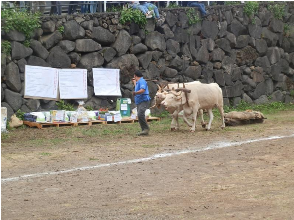
Arrastre. San Isidro.

El XXIII Concurso de Arrastre Isla de la Palma, Trofeo Gobierno de Canarias, comenzó ayer sábado con la primera prueba de arrastre dentro del marco de la Feria de San Isidro en Breña Alta. Concurso Insular de