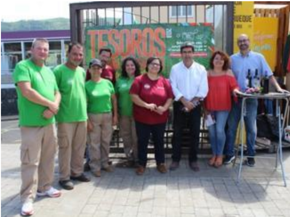
Un instante de la presentación del programa