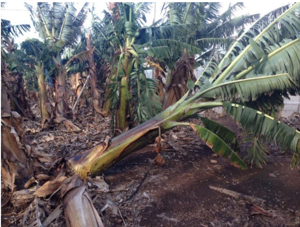
Plataneras dañadas por el temporal de viento. DA

Asprocan alerta de que la meteorología ha provocado una fuerte caída de la producción que, en lo que va de año, ha generado la pérdida de más de 14,5 millones de kilogramos