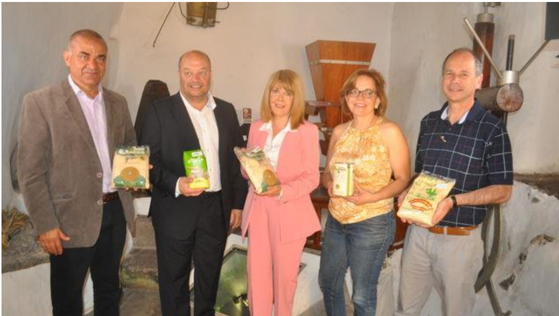
Momento de la presentación del fallo de 2018, en Fargas (Gran Canaria)

La Gomera logra en esta cuarta edición del concurso 15 de los 18 galardones del certamen, mientras que Tenerife obtiene dos premios y Gran Canaria uno; La Palma no presentó producto a concurso