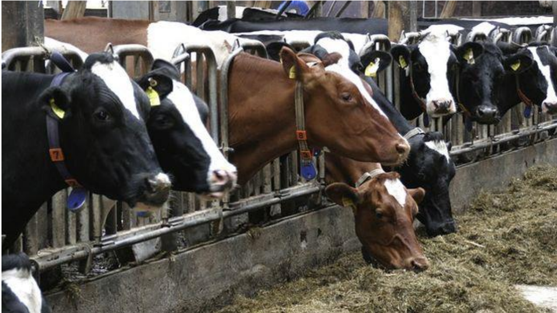
Granja de vacas de leche, en Canarias

de restar a los balances de leche y carne para consumo directo