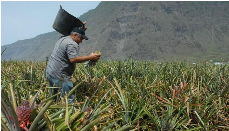
Plantación de piña en El Hierro

Se apoya la comercialización local de frutas y hortalizas, el cultivo de vides destinadas a la producción de vinos con DOP y su transformación, embotellado y comercialización exterior, los terneros nacidos de no nodriza, los productores de leche de vaca y de caprino-ovino, la producción de pollos de engorde y de huevos de gallina