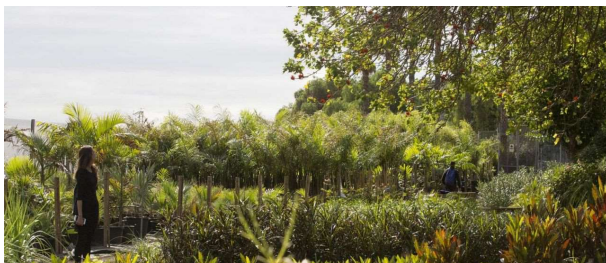
Plantas y flores en el vivero municipal de Santa Cruz de Tenerife.

Agricultura inyecta una potente subvención a uno de los ámbitos más afectados por la crisis económica derivada de la pandemia